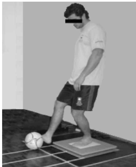
Figura 1. Atleta executando a avaliação estabilométrica.

Os dados foram coletados com frequência de amostragem de 100 Hz e foram selecionados três segundos referentes ao tempo necessário para execução do movimento de passe e restabelecimento da posição inicial para posterior análise, realizada sem qualquer processo de filtragem de sinal. Tendo em vista os objetivos do estudo, optou-se pela análise dos seguintes parâmetros mensurados na avaliação estabilométrica: 1) amplitude total de deslocamento do COP no eixo X (deslocamento médio-lateral, em cm); 2) amplitude total de deslocamento do COP no eixo Y (deslocamento ântero-posterior, em cm); e 3) velocidade média de deslocamento do COP nos três segundos de avaliação do movimento (em cm/s) 20 .